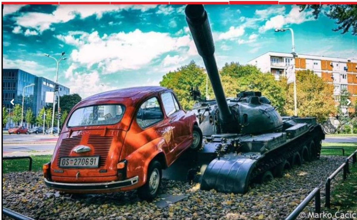
Spomenik u Osijeku

Može se prigovoriti da ima i drugačijih pristupa umjetnosti, da je taj spomenik s tenkom i ratnicima konceptualni pristup u kojemu je ideja važnija od samoga djela. No ta bi ideja morala davati rezultate umjetnosti kao i ostala umjetnost. Uništeni tenk ne