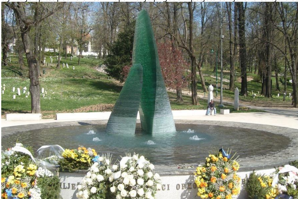
Mensud Kečo: Spomenik poginuloj djeci Sarajeva

Sarajevo nije „običan“ grad. Sarajevo geostrateški i geopolitički ima šansu biti „evropski Jeruzalem“ jer je već tisućama godina susretište imperija, religija, kultura i civilizacija, a taj mu je epitet potvrdio i sam Papa Franjo prigodom posjete Sarajevu. U Sarajevu su